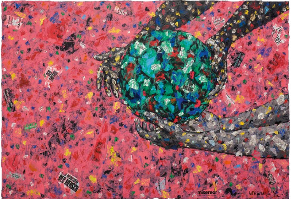
Das Misereor-Hungertuch 2023 „Was ist uns heilig?“ von Emeka Udemba. © Misereor